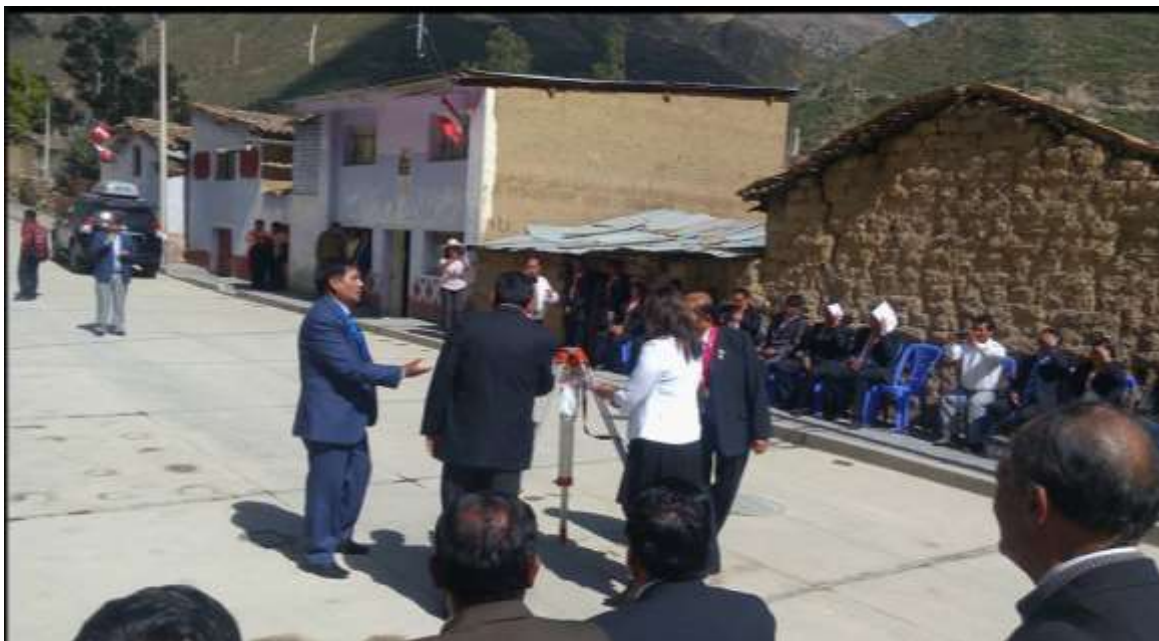
Pavimentación de las calles Gutiérrez Cándia, jr. Aymaraes y el Jr. San Martín de Porres en el barrio de Canchuilca

Luego de un breve recorrido por las calles pavimentadas, dejó inaugurada los jirones Gutiérrez Cándia, el Jr. Aymaraes y el Jr. San Martín de Parres del Barrio de Canchuilca