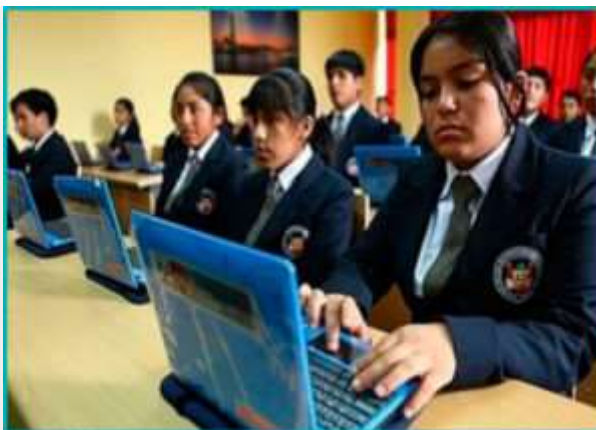
La Red de Colegios de Alto Rendimiento inició clases en 18 regiones

Hoy iniciaron clases los estudiantes de tercero, cuarto y quinto de secundaria de dieciocho de los colegios pertenecientes a la Red de Colegios de Alto Rendimiento (COAR), quienes recibirán una formación integral especializada con altos estándares de calidad nacional e internacional que les permitirá fortalecer sus competencias personales, académicas, artísticas y deportivas.