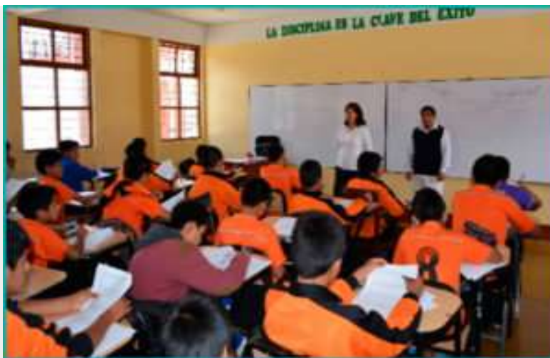
875 estudiantes rendirán evaluación de la primera fase de ingreso al COAR en Apurímac