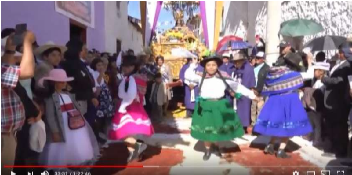
Tres mujeres, escenificando el Tarinakuy