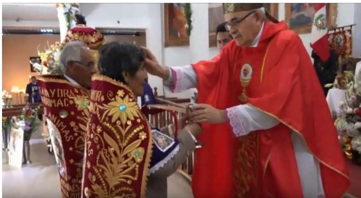
Ofrendas al Señor de Ánimas, por parte de los Priostes y capitanes de plaza