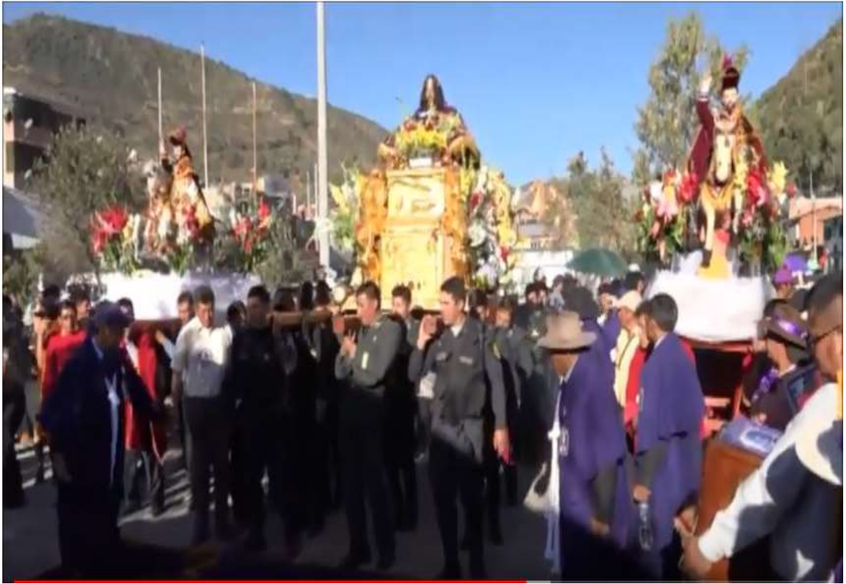
Encuentro de Patrón Santiago de Pairaca y el Señor de Ánimas en Layccapaya