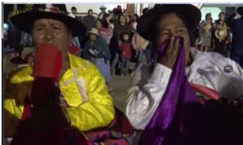
Entonando el harawi ‘allin causay’, en Av. Panamericana