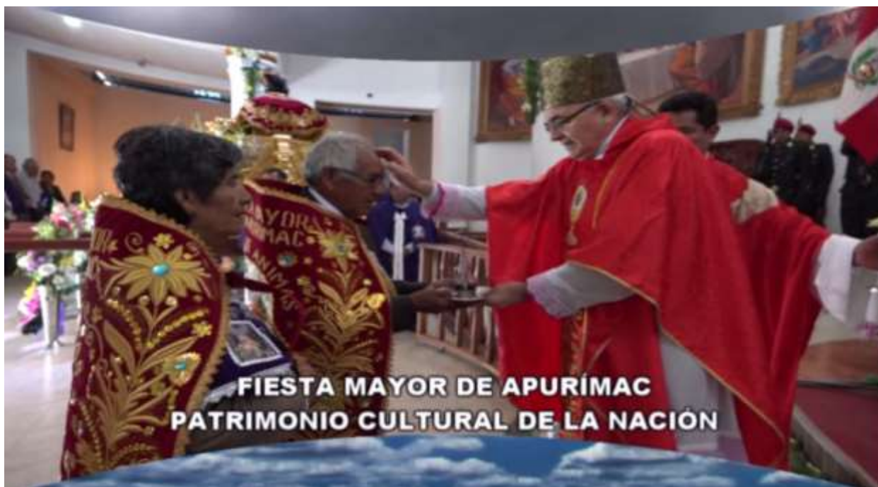
Ofrendas al Señor de Ánimas, por parte de los Priostes y capitanes de plaza