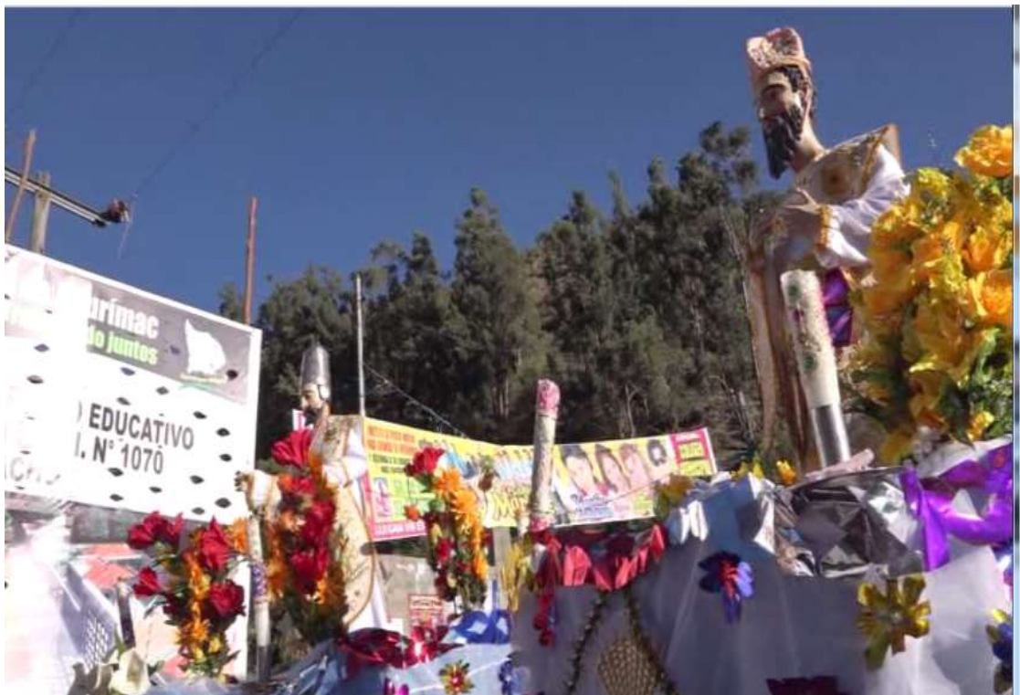
San Pedro y San Pablo a la altura del puente Chalhuanca- Chuquina