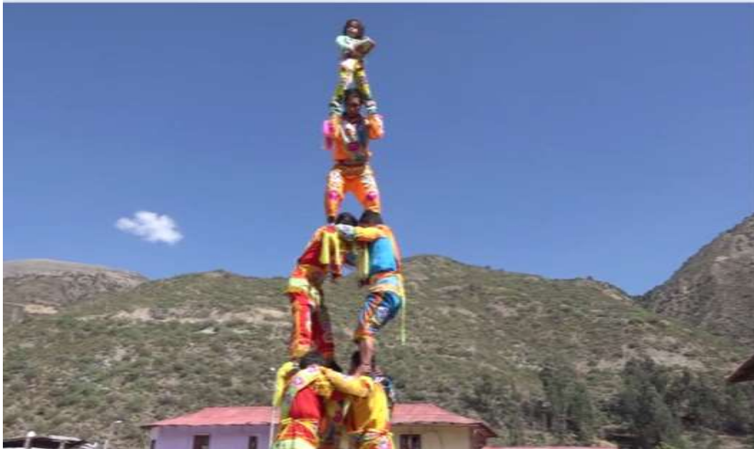
Los negritos de Andahuaylas al son del bombo, tambor y violín, hicieron sus acrobacias en diferentes lugares del recorrido de la Procesión del Señor de Ánimas