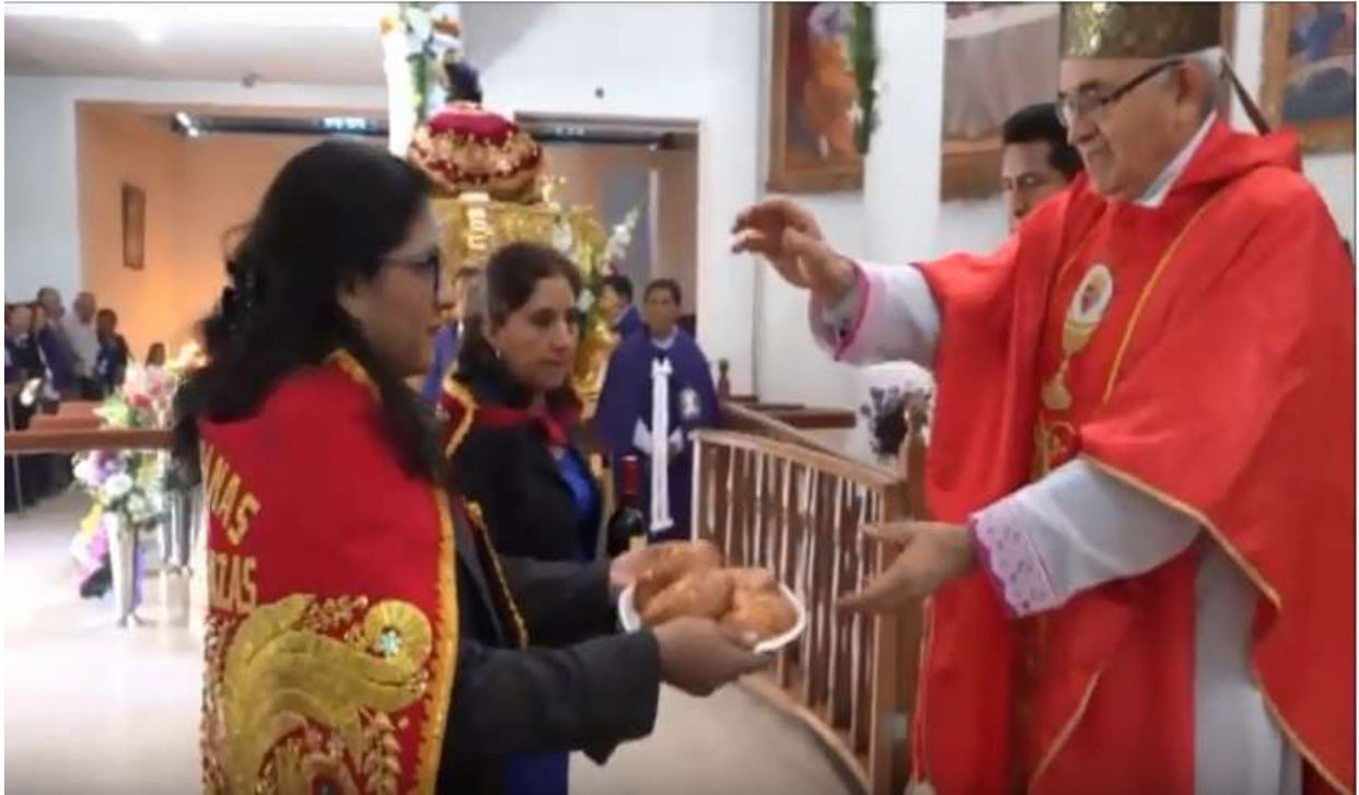
Ofrendas de hijos e hijas de los Priostes, al Señor de Ánimas