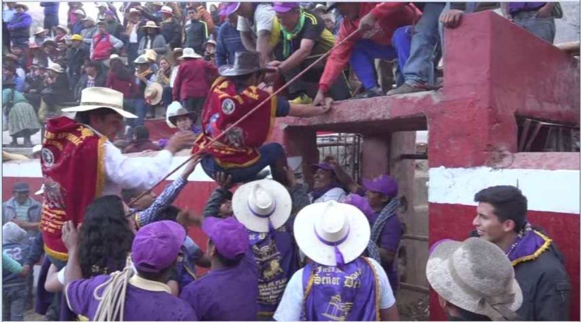
Los futuros carguyoc's del 2018 fueron subidos al toril