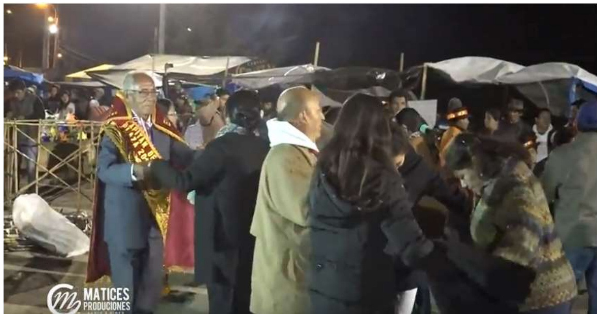
Serenata al Señor de Ánimas 2017

En esta fase de la fiesta previo al día central celebraron la víspera el día 30 de Julio; desarrollándose varias actividades de acuerdo al programa elaborado por la institución Matriz, los priostes y capitanes de plaza dando inicio a tempranas horas con la recepción de la banda de músicos, luego la celebración de la misa a cargo del párroco de la Doctrina de la Provincia, con participación plena de los priostes, capitanes de plaza, miembros de la Institución Matriz, la Hermandad del "Señor de Ánimas", el Comité Pro Construcción del Santuario, cargos menores y la población en su conjunto; acto seguido se desarrollaron otras actividades en la explanada y ruedo del "Señor de Ánimas" como: El izamiento del Pabellón Nacional, bandera del "Señor de Ánimas" y bandera de la provincia de Aymaraes a cargo de los priostes, capitanes de plaza, institución matriz, autoridades y la población en general; realizándose la actividad del gran atipanakuy, presentación de banda de músicos, arpa y violín, etc. En la tarde se programó la actividad de la tarde cultural folklórica y gastronómica, saludo y homenaje a nuestro "Señor de Ánimas" por las diferentes agrupaciones. Al culminar la tarde de este día, hubo la entrada de los chamiceros consistente en