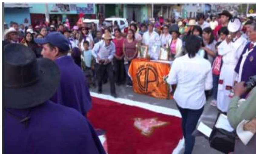
Señor de Ánimas en la puerta del club Unión Panamericana de la ciudad de Chalhuanca

En medio de saludos y baile entre los santos de Pairaca y Chuquina se despidieron del Señor de Ánimas en la esquina del movimiento. Luego visitó a la cooperativa San Pedro de Andahuaylas y al local del Club Unión Panamericana