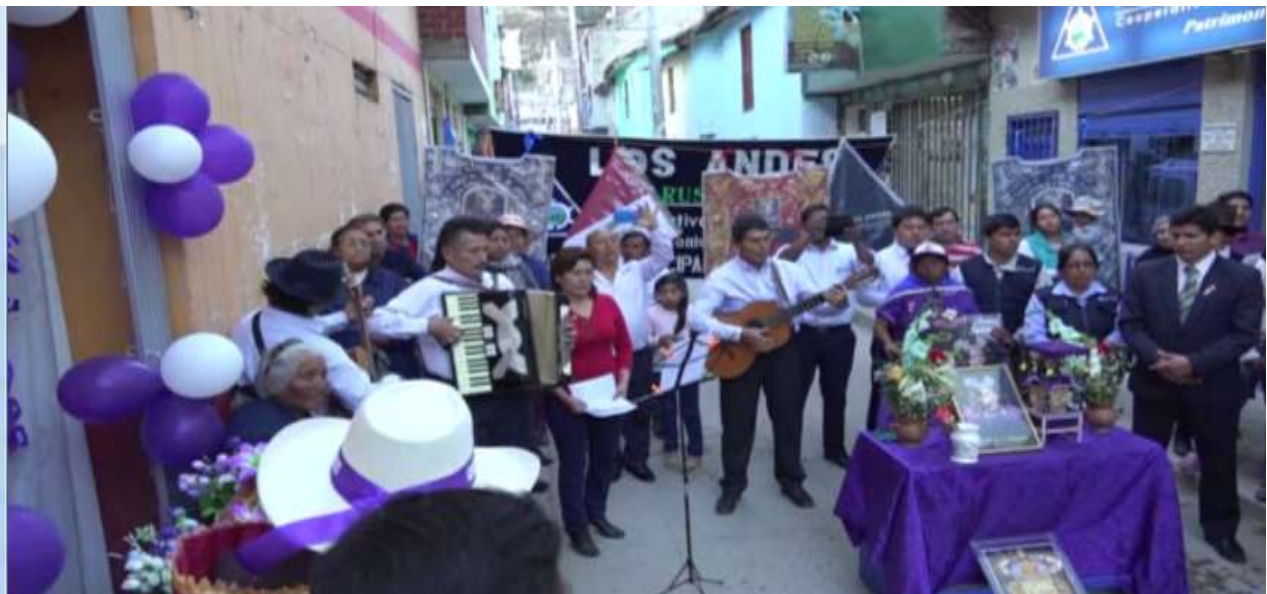
Canción de despedida de los santos con la canción del Señor de Ccoyllurty