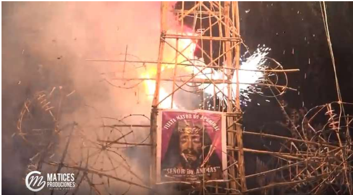
Serenata al Señor de Ánimas 2017