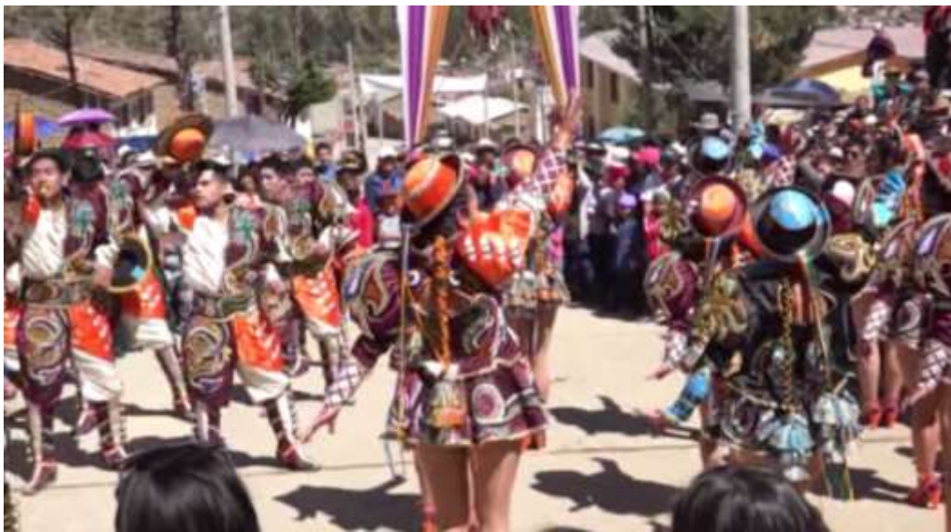
Presentación impresionante de los caporales en plazas y calles de la ciudad