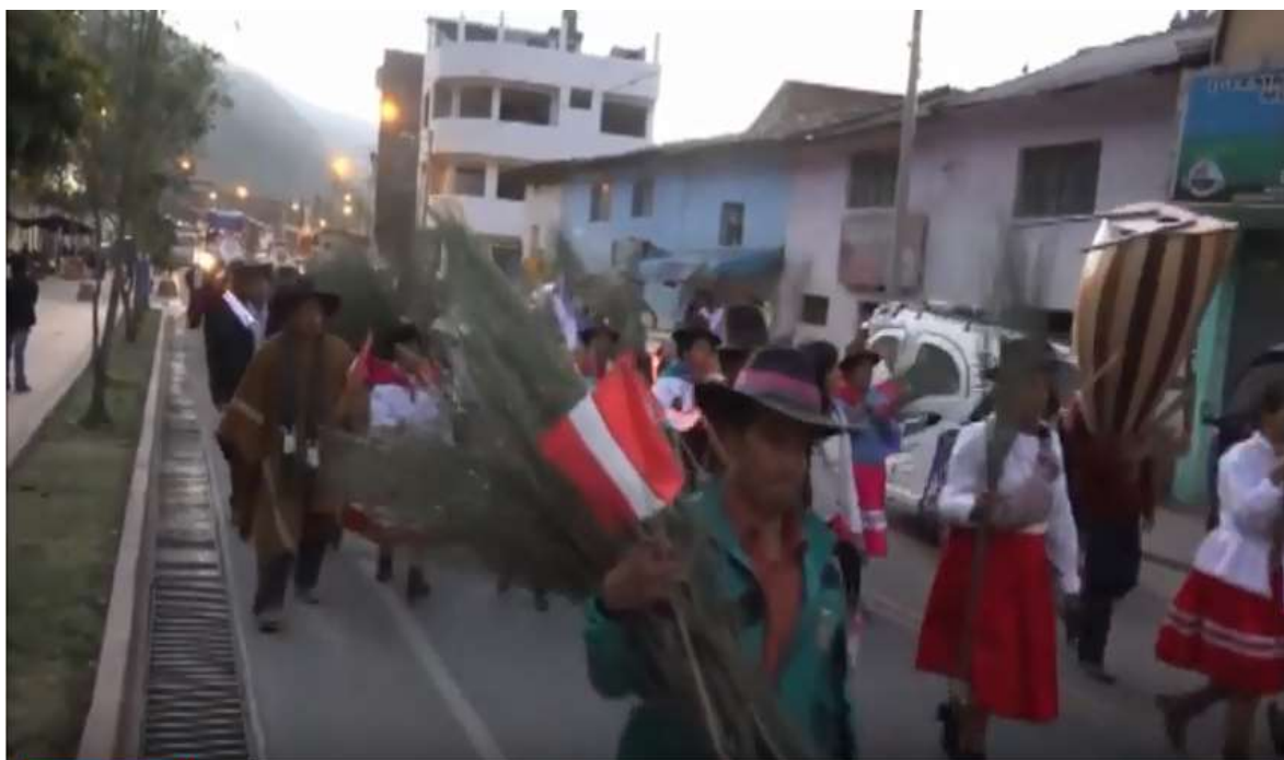
Entrada de chamiseros hacia la explanada del Señor de Ánimas 2017