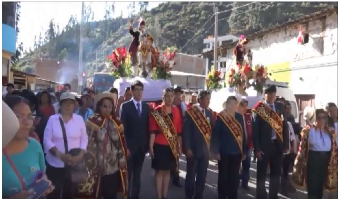
San Felipe y el Patrón Santiago de Pairaca, en su encuentro con el Señor de Ánimas en Laiccapaya 2017