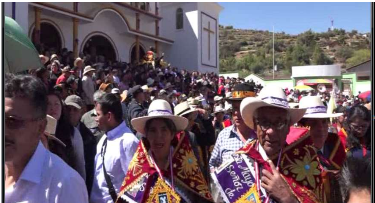
Los capitanes de plaza y priostes saliendo del Santuario Señor de Ánimas