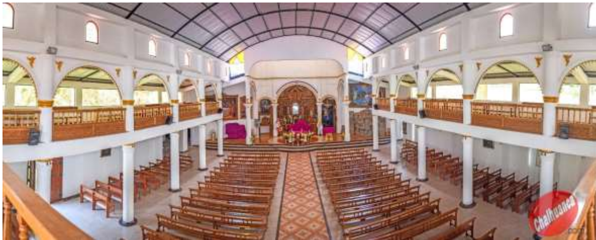
Santuario Señor de Ánimas, vista por el interior(2017)