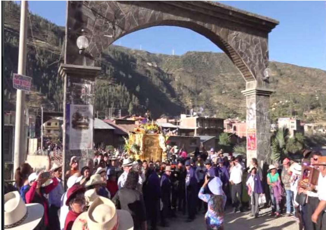
Señor de Ánimas recibiendo saludos de San Pedro y San Pablo, a la altura del arco del puente Chalhuanca-Chuquina