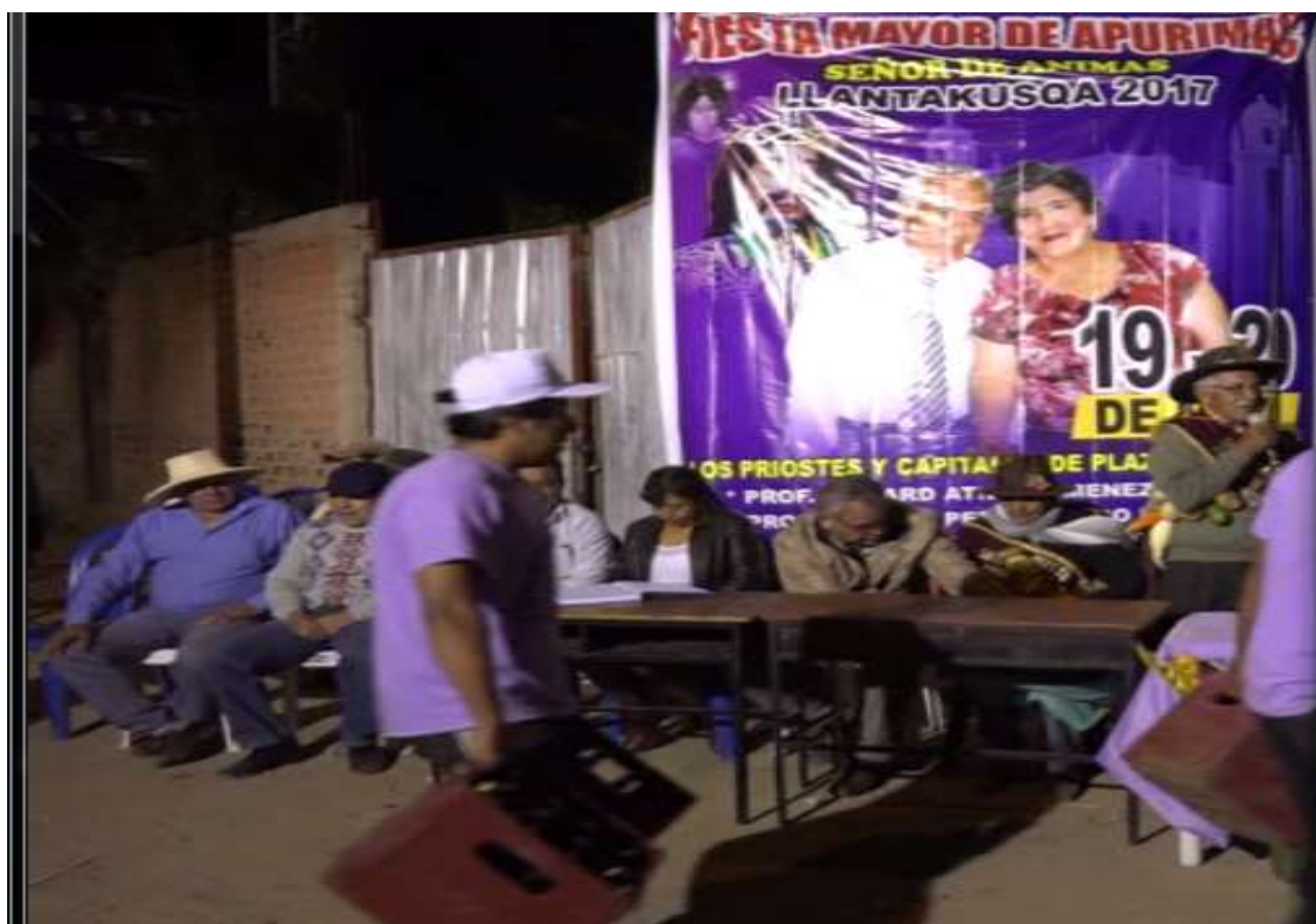
Llantakusqa, según la propaganda fueron los días 19 y 20 de mayo del 2017

La comunidad de Chancahua se destacó con el Ccarahui el ‘allin causay’ . También entraron la comunidad campesina de Lambrama. La comunidad campesina de Unchiña, dio una hermosa escenificación del toro-toro. Casi todos portaban en la espalda las divisas color morado con inscripciones alusivas a la fiesta del Señor de Ánimas 2017, agitando en sus manos las banderitas peruanas o moradas.