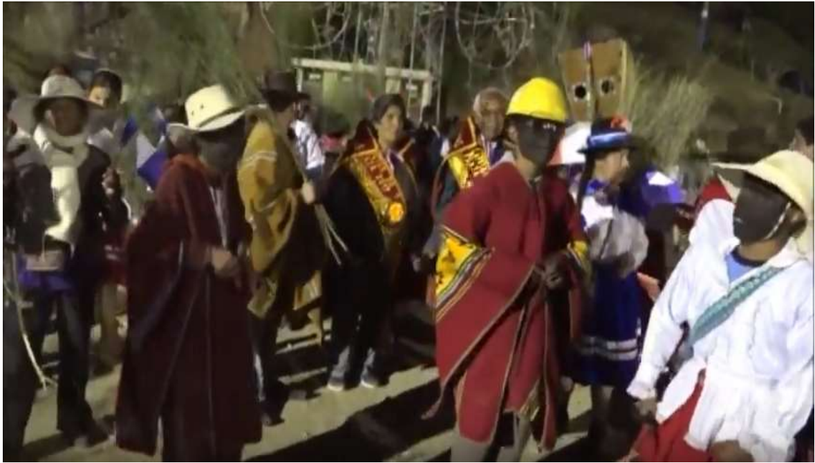
Los negrillos o huacones en la chamiza de víspera de las 3 de la tarde