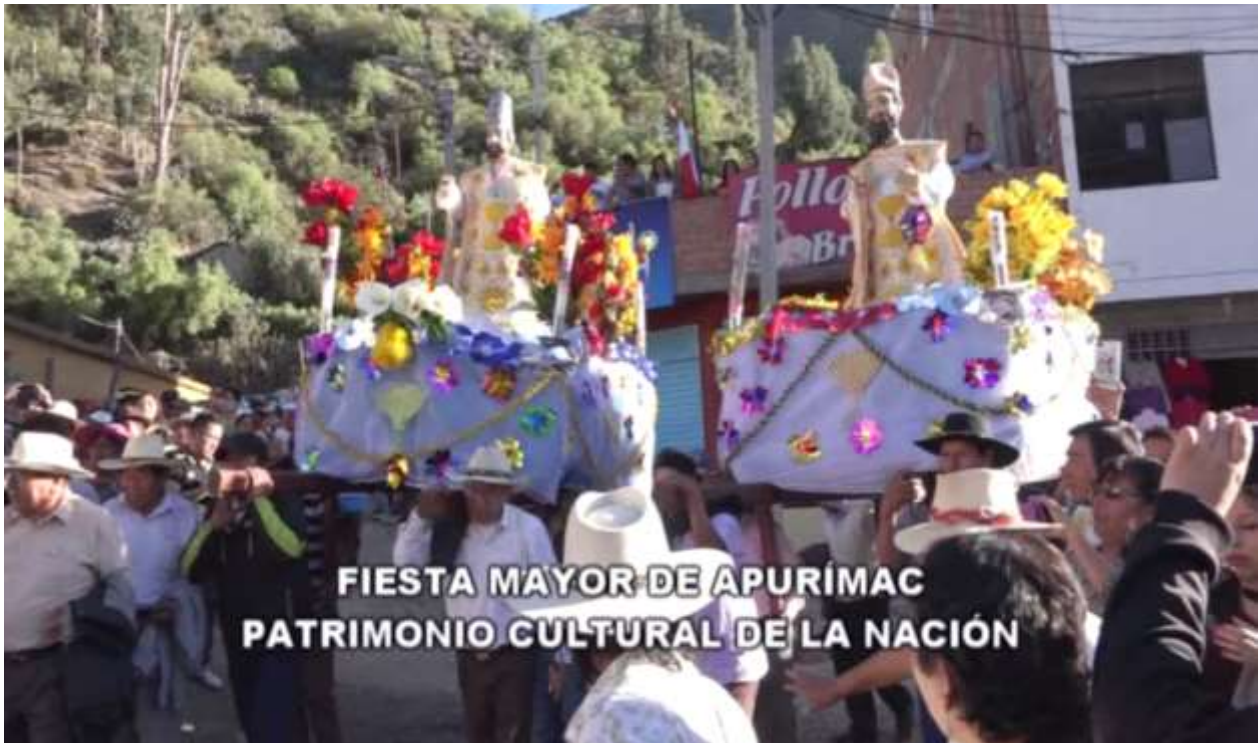
San Pedro y San Pablo del pueblo de Chuquina en el parque Bolívar de Chalhuanca