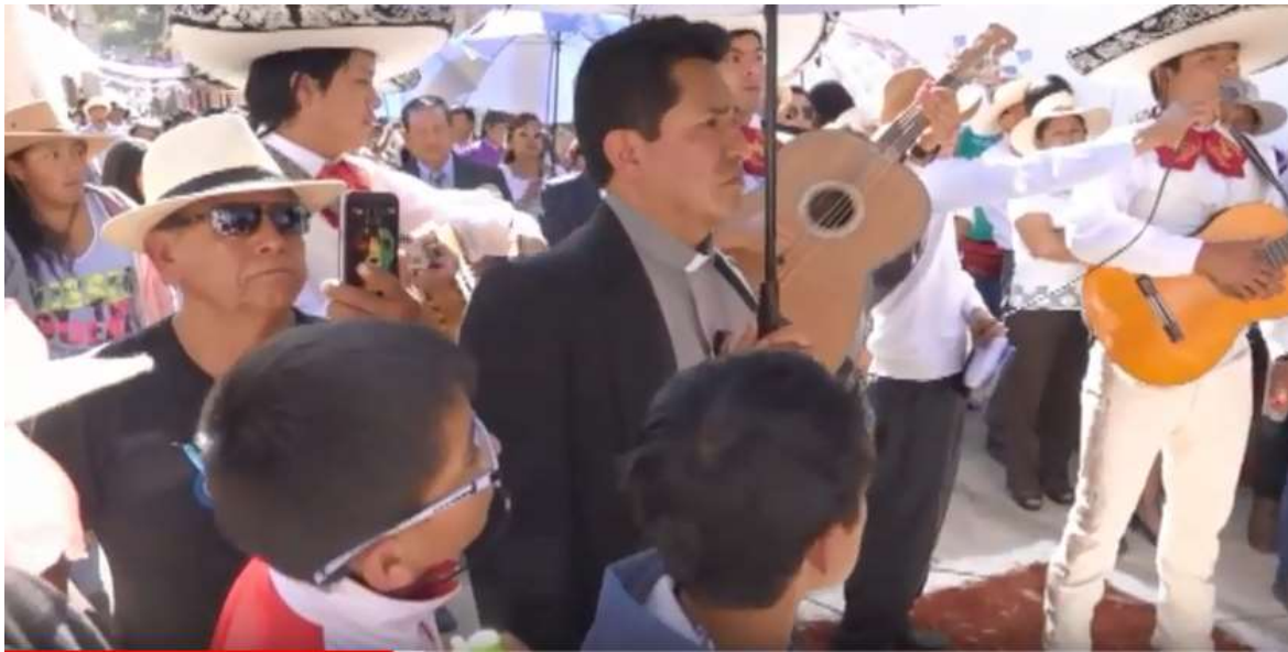
Los charros cantando una canción dedicado al Señor de Ánimas 2017, canción “amor eterno” de Juan Gabriel

Tú eres la tristeza de mis ojos Que lloran en silencio por tu adiós Me miro en el espejo y veo en mi rostro El tiempo que he sufrido por tu adiós Obligo que te olvido en el pensamiento Pues, siempre estoy pensando en el ayer Prefiero estar dormida que despierta De tanto que me duele que no estés Como quisiera, ay Que tu vivieras Que tus ojitos jamás se hubieran Cerrado nunca y estar mirándolos Amor eterno E inolvidable Tarde o temprano estaré contigo Para seguir, amándolos Yo he sufrido tanto por tu ausencia Desde ese día hasta hoy, no soy feliz Y aunque tengo tranquila mi conciencia Sé que pude haber yo hecho más por tí Obscura soledad estoy viviendo La misma soledad de tu sepulcro Tú eres el amor de cual yo tengo El más triste recuerdo de Acapulco