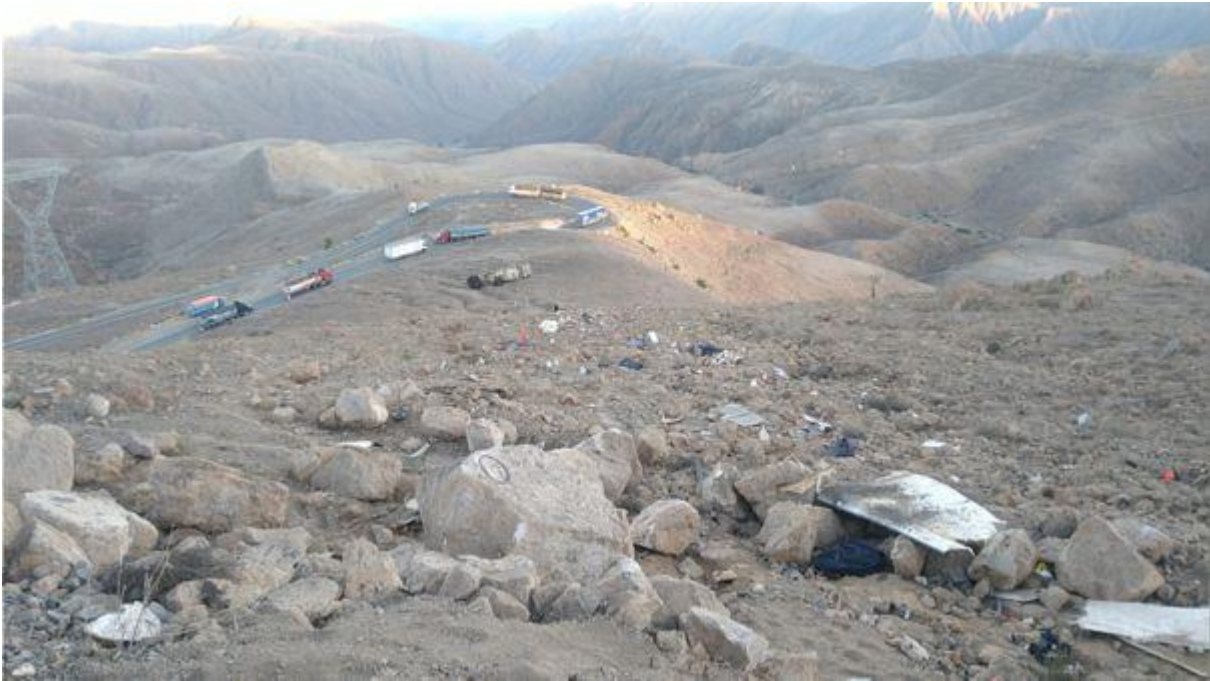
Diecisiete fallecidos deja el accidente de tránsito en el kilómetro 40 de la carretera Interoceánica.