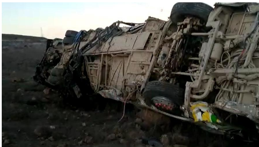
La compañía de Bomberos de Nasca indicó que encontraron catorce fallecidos en la pendiente, por donde cayó el bus.

El bus de la empresa Palomino trasladaba a 50 pasajeros, de acuerdo al parte policial. "Han encontrado a 14 fallecidos en el trayecto de la caída del bus, como se conoce, esa zona es con pendientes, cerros altos", indicó el Capitán Néstor Martínez, de la compañía de Bomberos de Nasca (Ica).