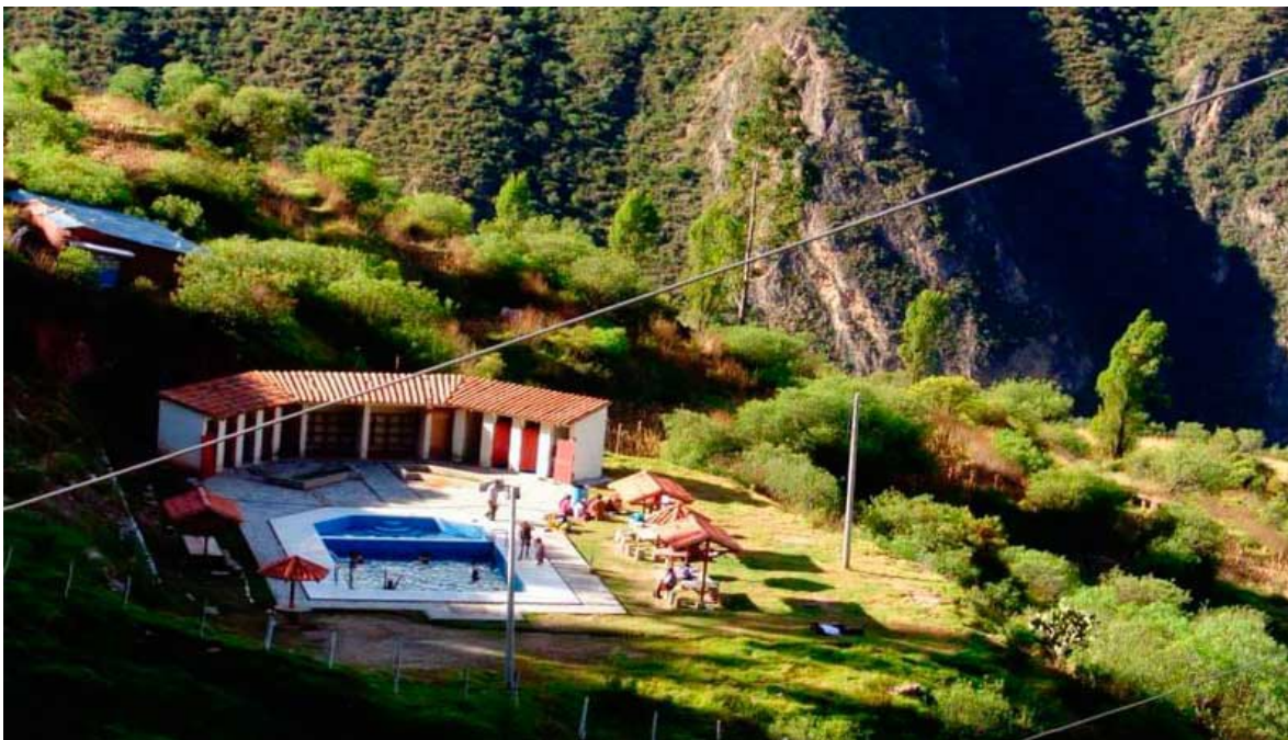
Rayó afectó energía eléctrica y ocasiona dos heridos

El día de hoy martes 21 de febrero en horas de la tarde, a poca distancia de los baños termales de Pincahuacho, a 5 Kms de la ciudad de Chalhuanca, capital de la provincia de Aymaraes, cayó un sorpresivo rayo acompañado de lluvia destruyendo el transformador de energía eléctrica. En ese momento se realizaba una fiesta carnavalera consistente en una gran yunza, donde participaban cerca de 100 personas. Los pobladores refieren que es la cuarta vez que se registra la caída de un rayo en este sector