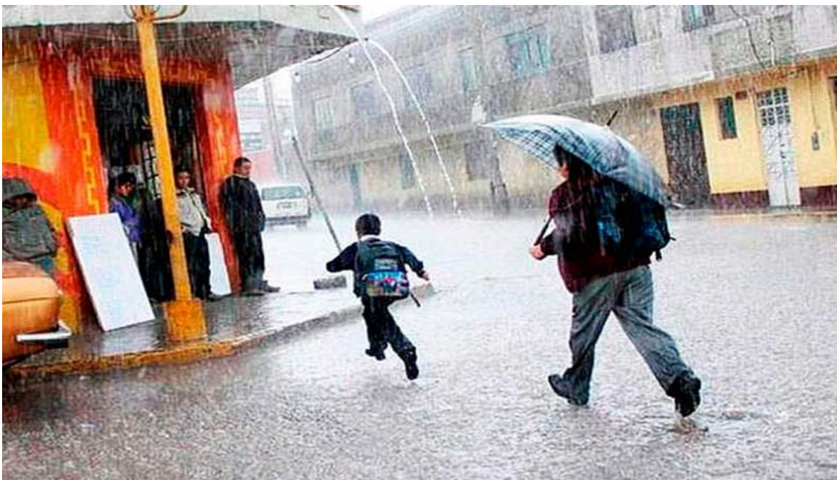
SENAMHI pronostica lluvias en Apurímac

El SENAMHI informa que, desde el martes 14 al miércoles 15 de febrero, se presentarán precipitaciones (nieve, granizo, aguanieve y lluvia) de moderada a fuerte intensidad en la sierra. Estas precipitaciones estarán acompañadas de descargas eléctricas y ráfagas de viento con velocidades cercanas a los 35 km/h. Además, se espera la ocurrencia de granizo en zonas por encima de los 2800 m s. n. m. y nieve en localidades sobre los 4000 m s. n. m. El miércoles 15 de febrero, se esperan acumulados de lluvia sobre los 17 mm/día en la sierra norte, por encima de los 16 mm/día en la sierra centro y valores cercanos a los 19 mm/día en la sierra sur. Se recomienda a los grupos de trabajo de las municipalidades del Departamento de Apurímac afectados con este evento, difundir el contenido del presente a la población a través de los medios de comunicación sociales de su localidad.