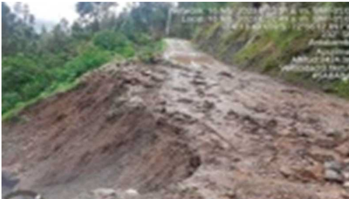
Huaico afectó vía y casas en Matará - Sabaino en Antabamba